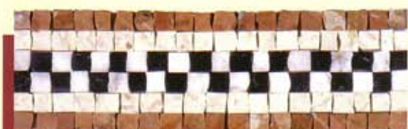
MARTE - (Cm.9x30) B-10-A