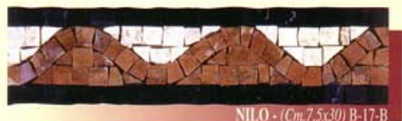
NILO - (Cm.7,5x30) B-17-B