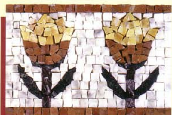
TULIPANI - (Cm.20x30) B-4-A