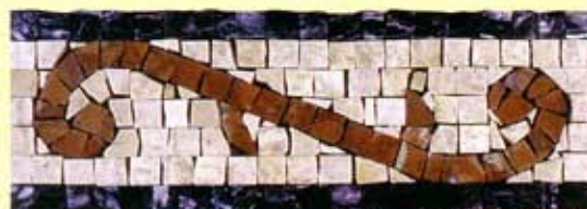
TESEO - (Cm.10,5x30) B-3-A