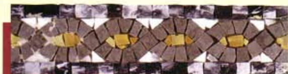
CLELIA - (Cm.7,5x30) B-7-C