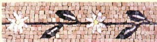
FLORIS - (Cm.9x40) A-7-A