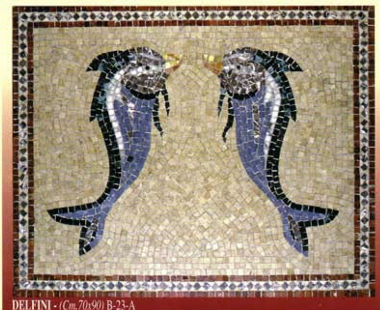
DELFINI - (Cm.70x90) B-23-A