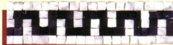
SPARTA - (Cm.7,5x30) B-5-B