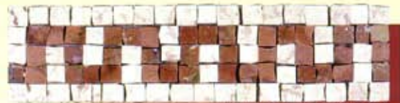
SPARTA - (Cm.7,5x30) B-5-A