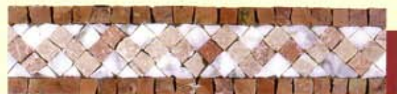
OLIMPO - (Cm.7,5x30) B-6-B