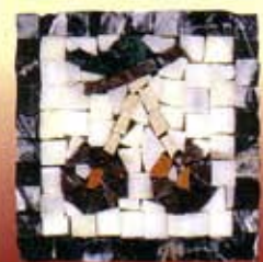
CILIEGE - C-5-A