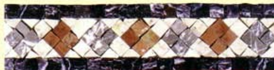
Priamo - (Cm.7,5x30) B-22-C