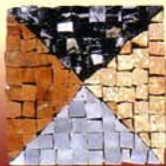
DIAMANTE - C-6-A