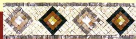
IRIDE - (Cm.10,5x40) A-2-A