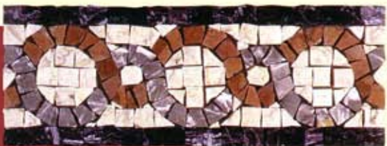
SIBILLA - (Cm.11x30) B-16-A