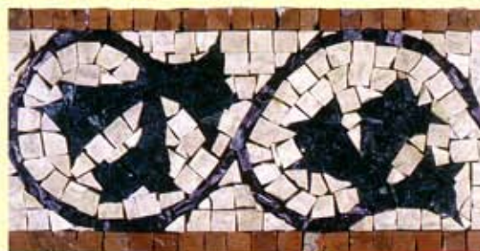
IDRA - (Cm.17x32) B-1-A