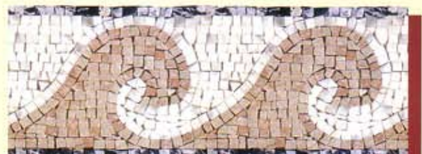
OCEANO - (Cm.17x40) A-3-A