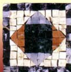
DIANA - C-4-A