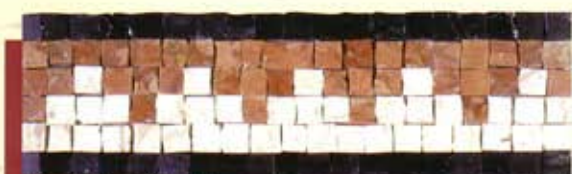
ARES - (Cm.9x30) B-9-A