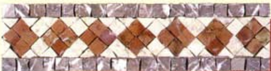
PRIAMO - (Cm.7,5x30) B-21-A