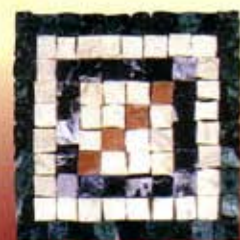
BACCO - C-1-A