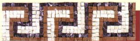
DELFI - (Cm.10x36) A-5-A