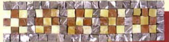
FESTO - (Cm.7,5x40) B-11-A