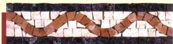
NILO - (Cm.7,5x30) B-17-A