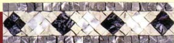
Priamo - (Cm.7,5x30) B-22-B