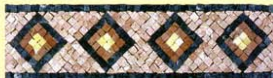
IRIDE - (Cm.10,5x40) A-2-B