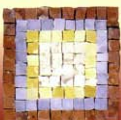
AUGUSTO - C-7-A