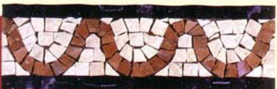
VULCANO - (Cm.9x30) B-17-A