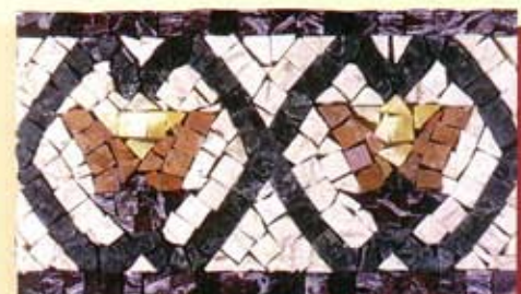
CHIMERA - (Cm.17x30) B-15-A