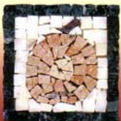
MELA - C-3-A