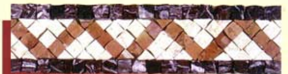
ZEFIRO - (Cm.7,5x30) B-24-A