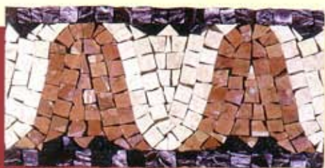
CALIPSO - (Cm.15x30) B-14-A