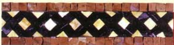
ETNA - (Cm.7,5x30) B-20-B