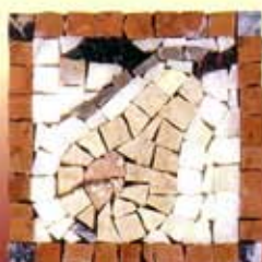
PERA - C-2-A