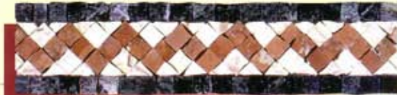
OLIMPO - (Cm.7,5x30) B-6-A