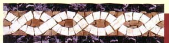
CLELIA - (Cm.7,5x30) B-7-A