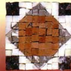
CESARE - C-8-A

Le bordure qui riportate sono una parte della nostra produzione di mosaici.