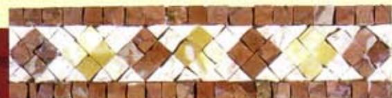
Priamo - (Cm.7,5x30) B-22-D