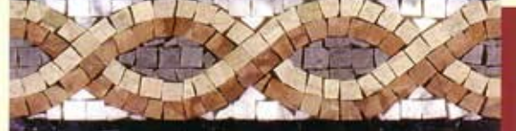
GALATEA - (Cm.15x36) B-8-A