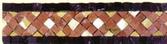
ETNA - (Cm.7,5x30) B-20-A