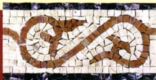
SIDONE - (Cm.17x34) B-2-A