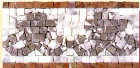
FEBO - (Cm. 15x30) B-31-A