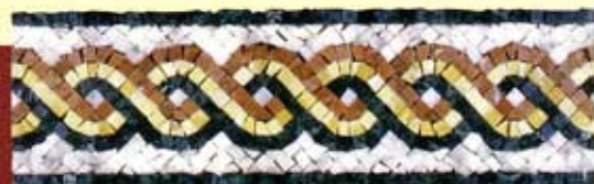
ARIANNA - (Cm.12x40) A-1-A